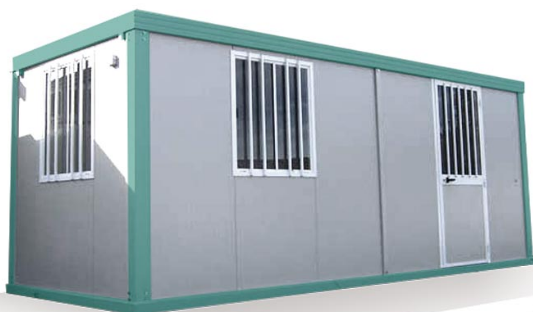
BUNGALOW SANITAIRE AS4