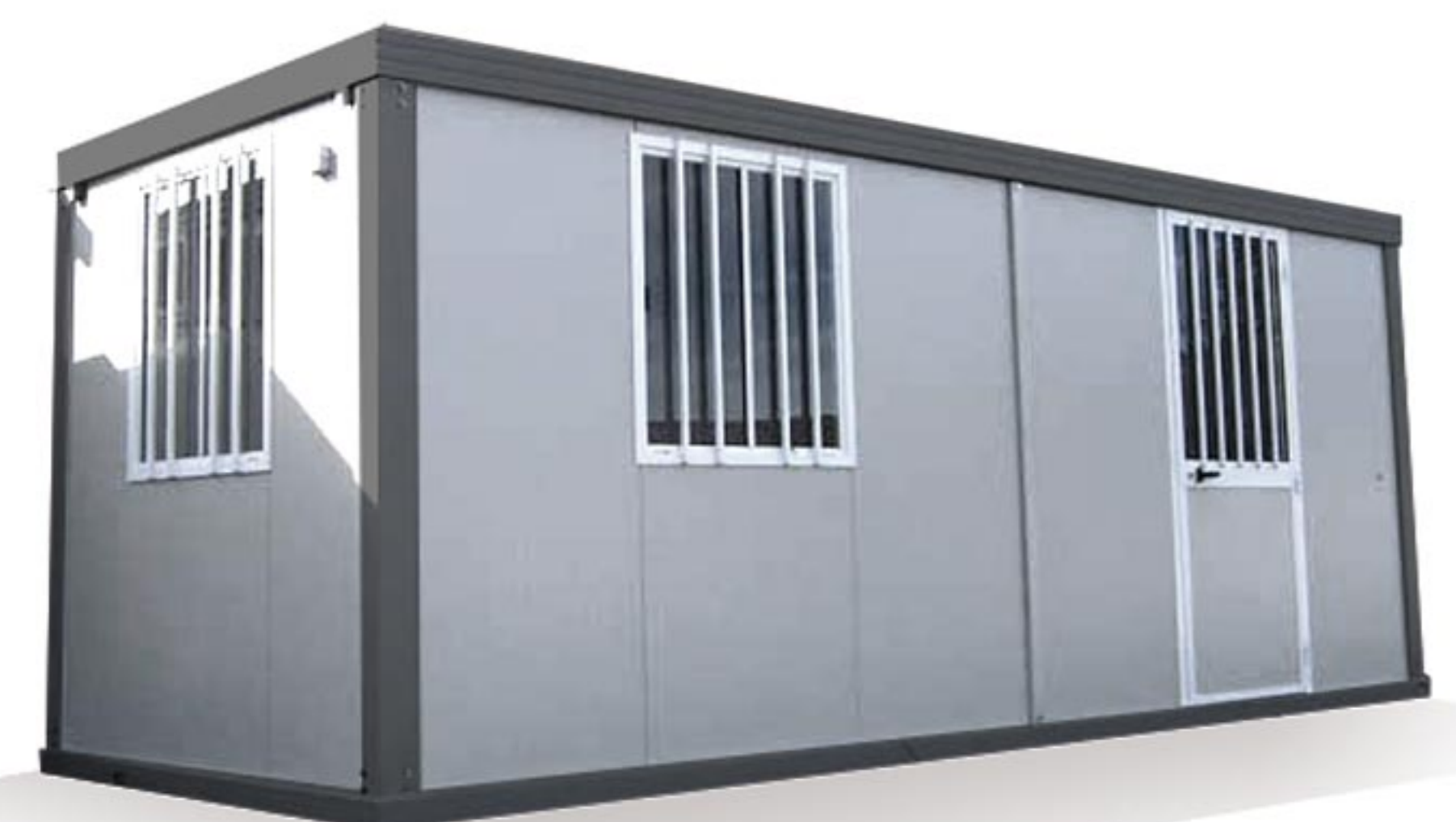
BUNGALOW SANITAIRE AS4