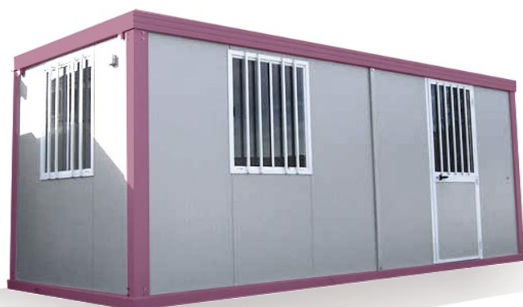
BUNGALOW SANITAIRE AS4